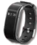
ウェアラブル活動計